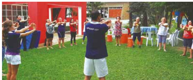
Alongamento durante o APCEF de Portas Abertas no clube, em 2015

Inscrições até 1º de agosto pelo convites@apcefsp.org.br ou (11) 3017-8319.