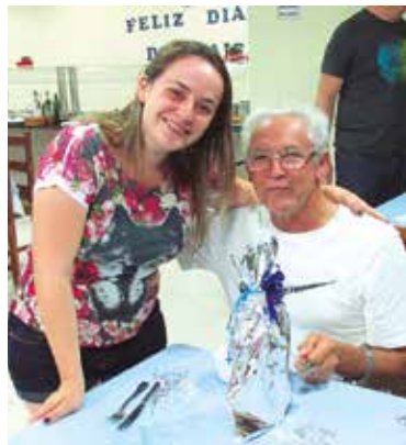
Comemoração do Dia dos Pais em Avaré, em 2015

Avaré, Campos do Jordão, Salto Grande e Ubatuba ainda têm vagas para hospedagem no fim de semana comemorativo.