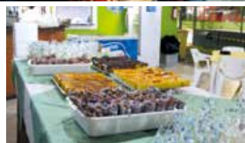
Festa típica na Colônia de Suarão, em 16 de julho. Para ver mais fotos, acesse www.apcefsp.org.br ou www.facebook.com/apcefsp