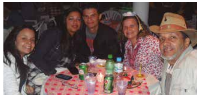
Acima, vencedores do torneio de Pôquer da APCEF/SP, disputado em 18 de julho. Abaixo, festa julina na Colônia de Ubatuba, dia 25 de julho