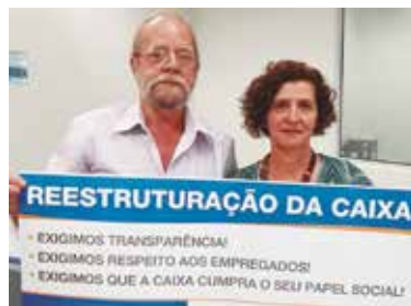
Manifestação contra a reestruturação em Jundiaí, em 10 de março