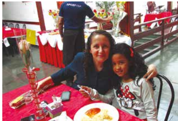
Comemoração do Dia das Mães em Avaré (acima) e Campos do Jordão. Para ver mais fotos, acesse www.apcefsp.org.br ou www.facebook.com.br/apcefsp