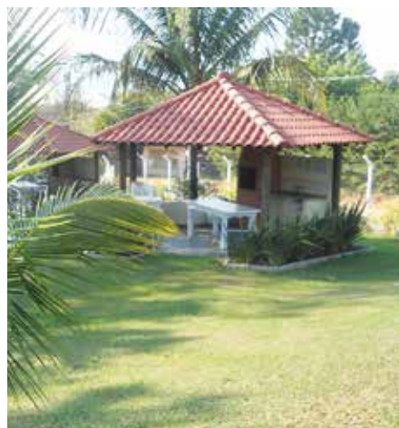
Sentido horário: o novo ginásio da Subsele de Bauru, a piscina e um dos quiosques com churrascueira

Anote na sua agenda: dia 11 de junho, sábado, tem uma grande festa na Subsele de Bauru para marcar a inauguração do novo ginásio coberto.