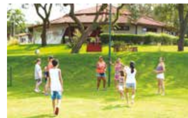
Espaço de lazer da Colônia de Avaré

A Colônia de Ubatuba está fechada para reforma neste mês de maio.