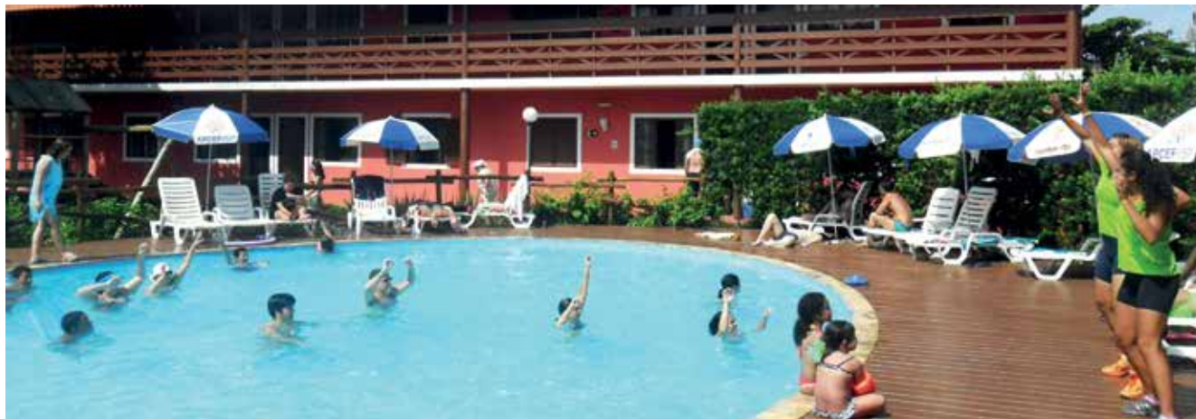
Colônia no litoral sul, na praia de Suarãõ, em Itanhaém