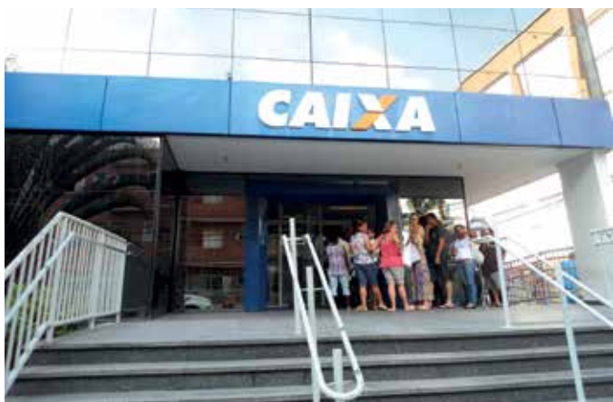
Acima, agência São Vicente fechada por causa do calor excessivo. Ao lado, aparelho e ar-condicionado quebrado

Diretoria do banco demonstra descaso e falta de planejamento e torna a vida de empregados e clientes um verdadeiro “inferno”