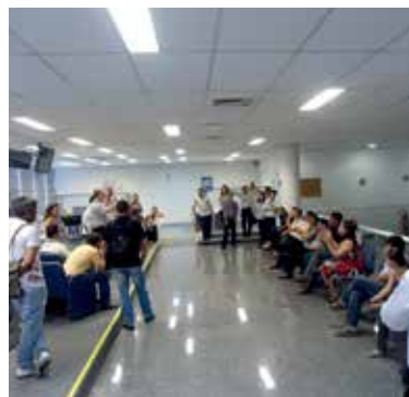
Representantes da APCEF/SP fazem reunião com empregados da agência São Vicente

No dia 8, foi a vez da agência São Vicente, também no litoral, suspender as atividades em uma ação conjunta entre a APCEF/SP e o Sindicato dos Bancários de Santos e Região.