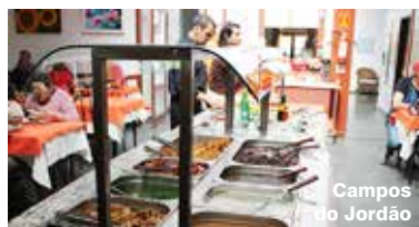
Campos do Jordão

Todas as Colônias da APCEF estão com promoções em abril e maio. Acesse nosso site e confira.