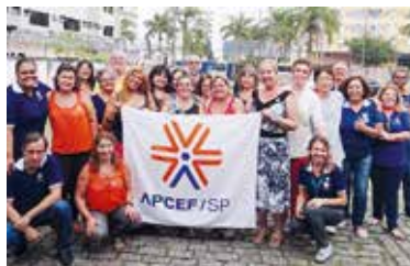
Acima, workshop de redes sociais em 23 de março e, abaixo, a última edição do APCEF de Portas Abertas, na Baixada Santista, no dia 17