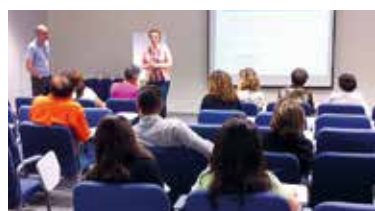
Encontro na SR Vale do Paraíba, dia 23