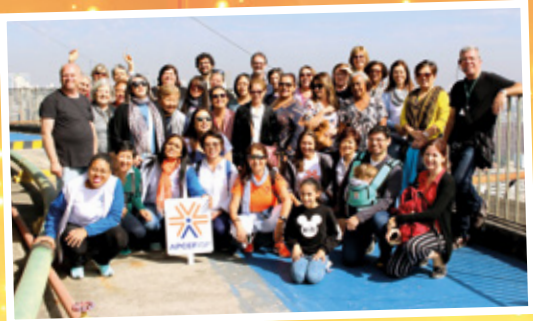
30/7 - APCEF de Portas Abertas e APCEF nos Passos da Cultura - centro de São Paulo