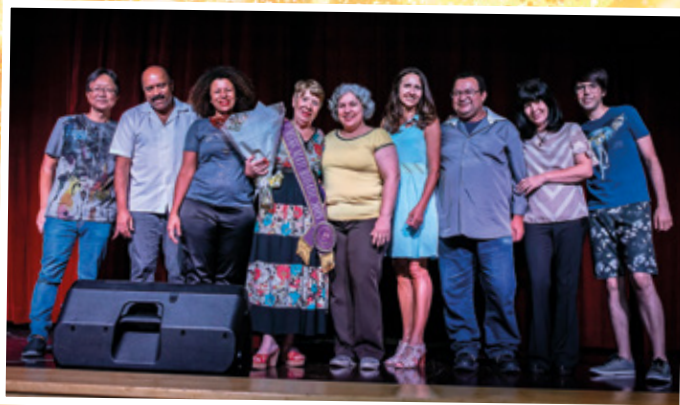
Comemoração do Dia dos Aposentados - Revelações