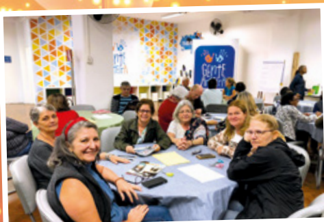
6/12 - APCEF nos Passos da Cultura - Caixa Cultural