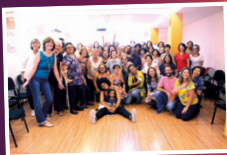
8/3 - APCEF de Portas Abertas - Dia Internacional da Mulher