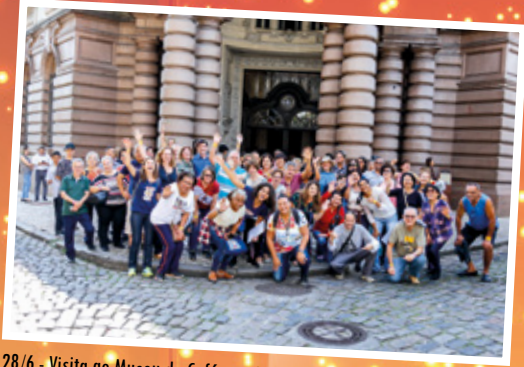
28/6 - Visita ao Museu do Café, em Santos