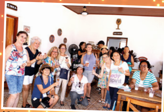
2 /2 - Festa da Uva em Jundiá