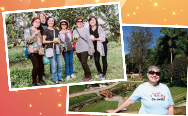
13/6 - APCEF nos Passos da Cultura - Templo e Sítio Nakahara