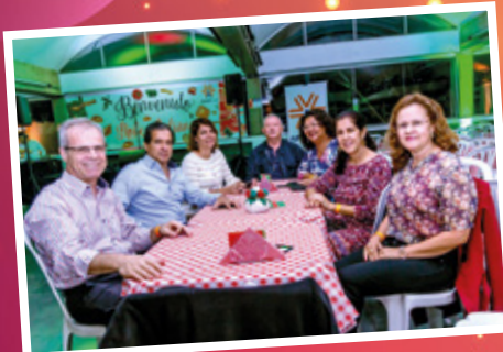
24/5 - Noite Italiana