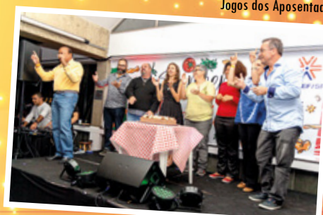
Noite Italiana no clube