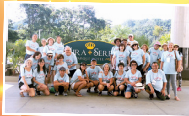
De 25 a 29/3 - Mira Serra Parque Hotel