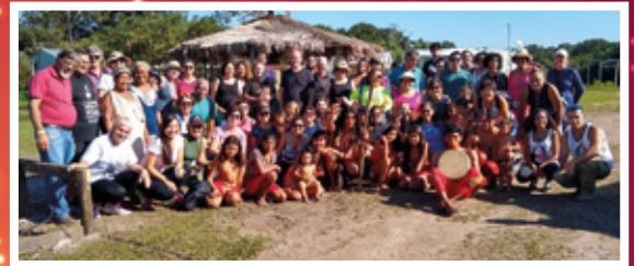
29/6 - APCEF nos Passos da Cultura - Estação Ecológica Jureia-Itatins