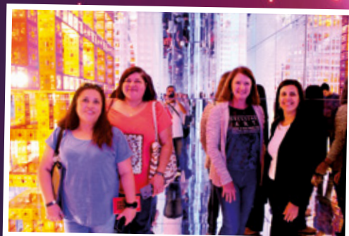
30/4 - APCEF nos Passos da Cultura - Farol Santander