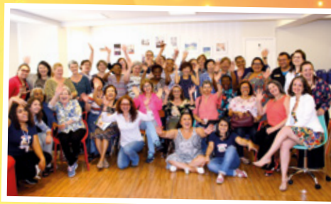
1/10 - APCEF de Portas Abertas - Outubro Rosa