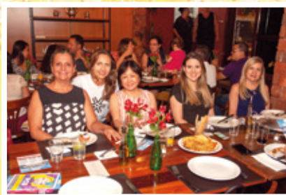
APCEF de Portas Abertas em São José do Rio Preto