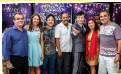
Comemoração do Dia dos Aposentados - Revelações