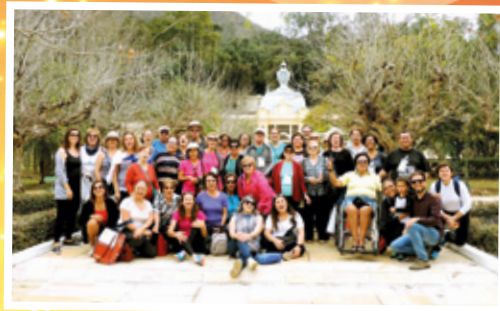
De 19 a 23/8 - Viagem a Caxambu