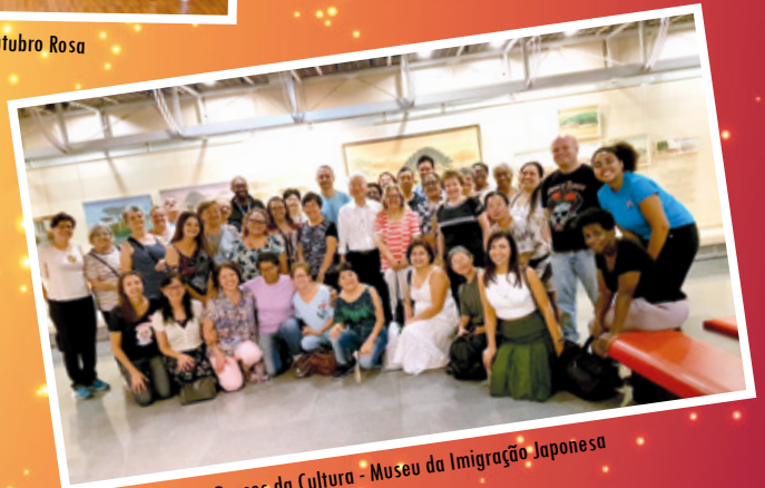
29/10 - APCEF nos Passos da Cultura - Museu da Imigração Japonesa