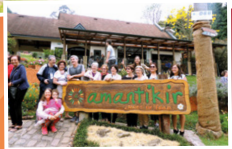
De 20 a 22/9 - Excursão para Salesópolis e Campos do Jordão