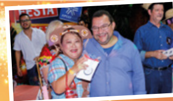
Festa Junina em Suarão