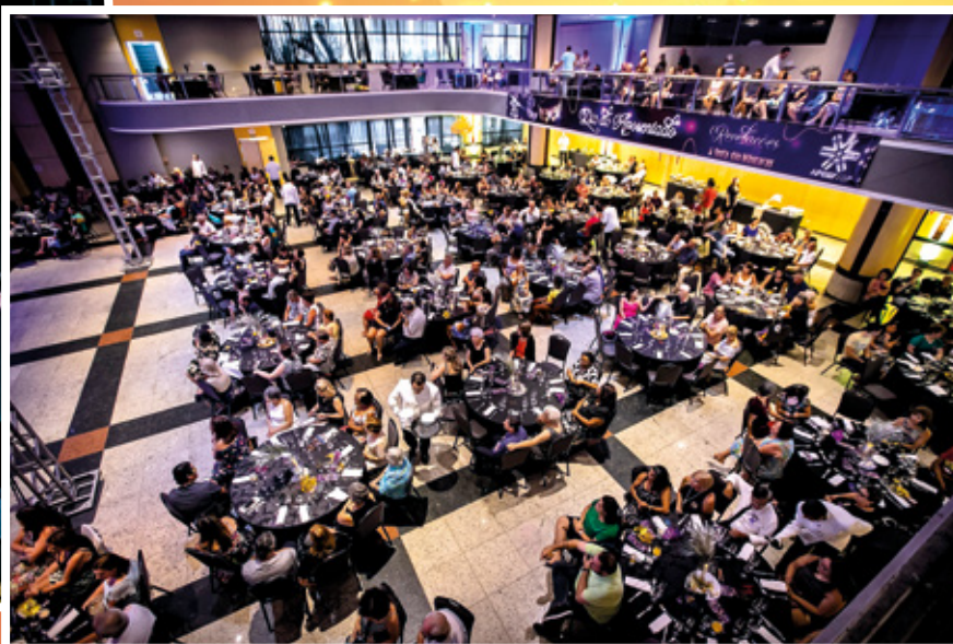
10/2 - Dia dos Aposentados - Revelações