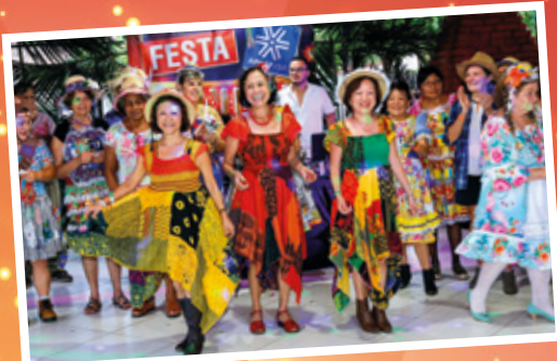
28/6 - Festa Junina em Suarão