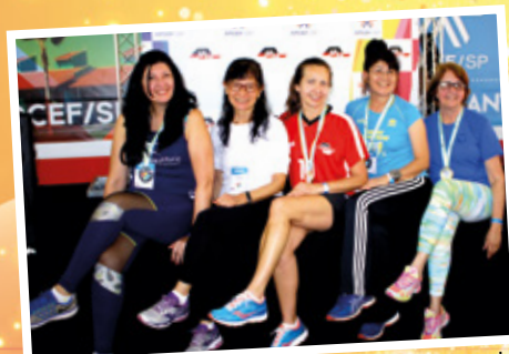
Jogos dos Aposentados