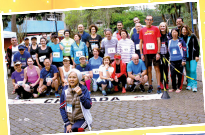
28 e 29/9 - Jogos dos Aposentados