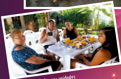
Dia dos Aposentados nas unidades