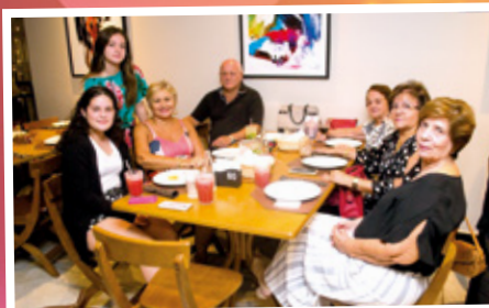
12/4 - APCEF de Portas Abertas em Ribeirão Preto