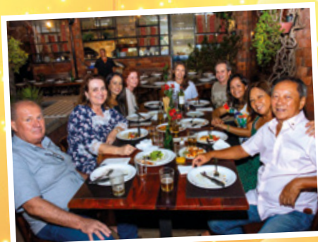
7/11 - APCEF de Portas Abertas em São José do Rio Preto