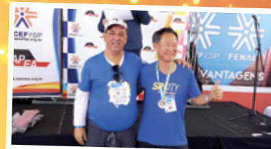
Jogos dos Aposentados