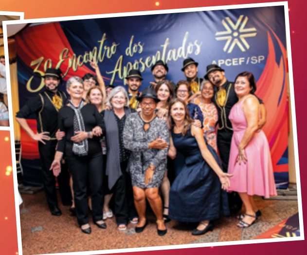
3/12 - Encontro Anual dos Aposentados