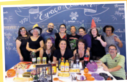
Curso de inglês