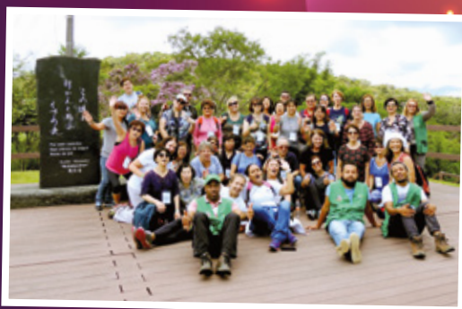
15/3 - APCEF nos Passos da Cultura - Parque Ecológico Imigrantes