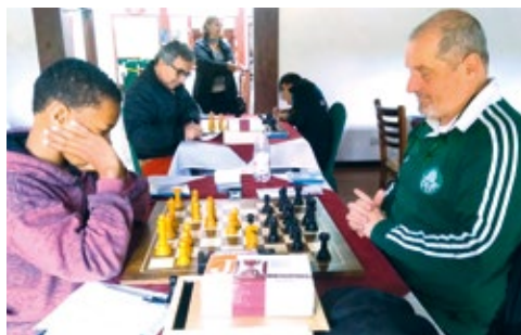
1º Torneio de Xadrez na Montanha, em 2018

A excursão sairá do clube da APCEF/SP na sexta-feira (29), às 19 horas, e da Barra Funda, às 20 horas.