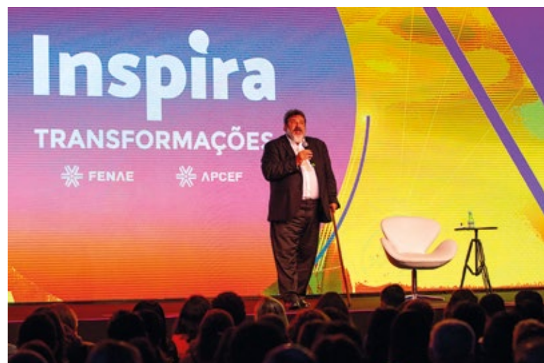
Mario Sérgio Cortella no Inspira Fenae 2019, em Belo Horizonte

:: Acesse www.fenae.org.br/rededoconhecimento ou inspira-fenae2020.fenae.org.br .