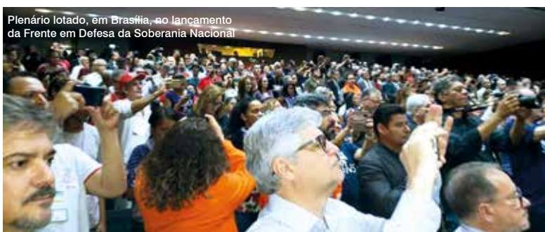
Plenário lotado, em Brasília, no lançamento da Frente em Defesa da Soberania Nacional

A divisão das agências em outras SRs da capital já foi encerrada. Os funcionários das agências digitais serão divididos entre as agências digitais Sé e Paulista.