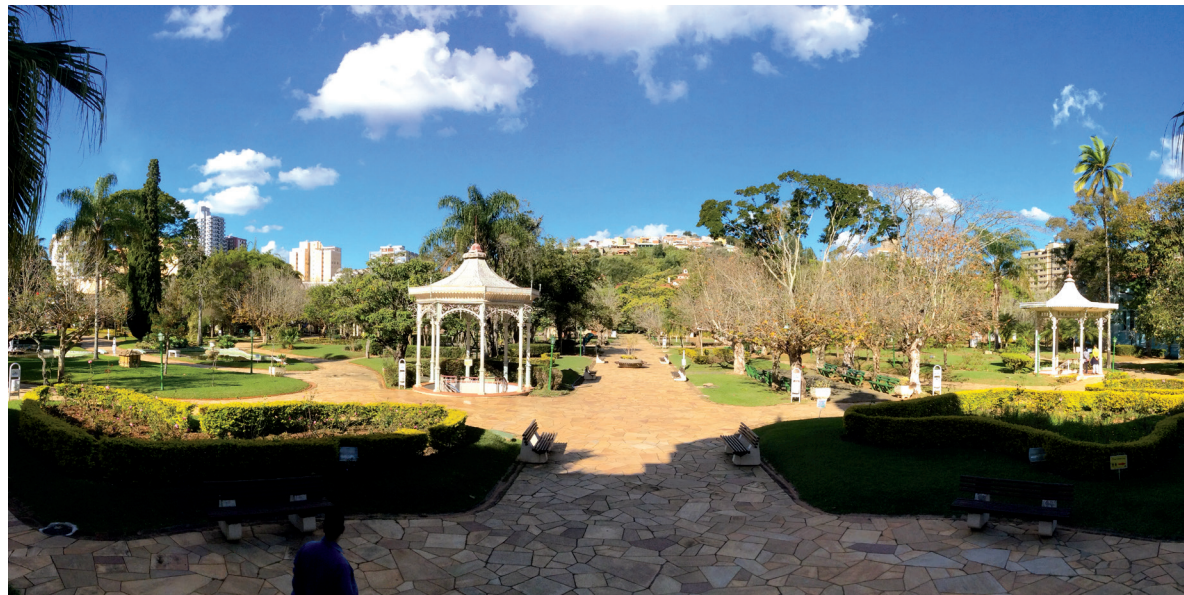
Parque das Águas, em Caxambu, com 12 fontes de águas minerais, gasosas e medicinais: é um dos atrativos da excursão da APCEF/SP