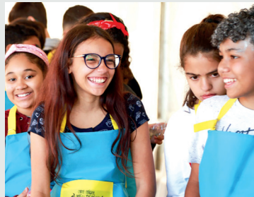
Nas Colônias da APCEF/SP é sempre mais divertido

Garanta seu passeio no mês das crianças. Ligue e reserve