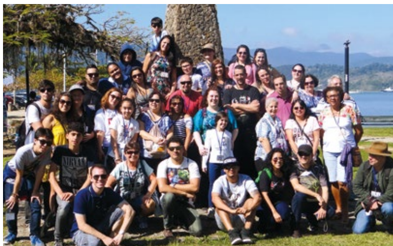
Participantes da excursão para a Festa Literária Internacional de Paraty, em 2016

Informações sobre valores e inscrições no site, pelo telefone (11) 3017-8339 ou envie e-mail para convites@apcefsp.org.br . Vagas limitadas.