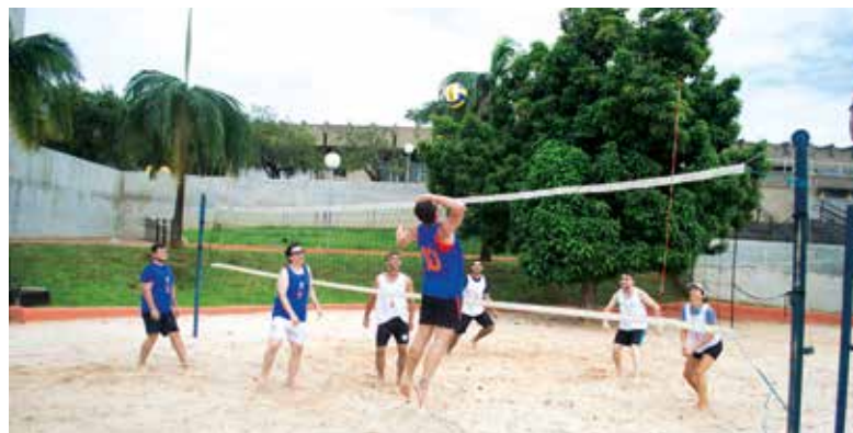
Jogo de vôlei no APCEF em Movimento no Sesi Ribeirão Preto, em 13 de abril

Faça inscrição pelo (11) 3017-8331, 3017-8355 ou convites@apcefsp.org.br .