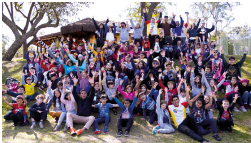
Galera que participou da primeira edição do Acantonamento de Férias da APCEF/SP em Avaré, em 2018

Ficha de inscrição, ficha médica, autorização e Manual do Acampante estão disponíveis no site da APCEF/SP.