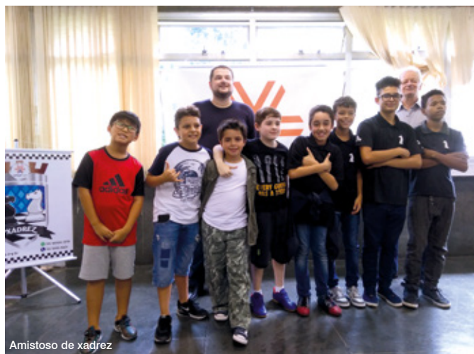
Amistoso de xadrez