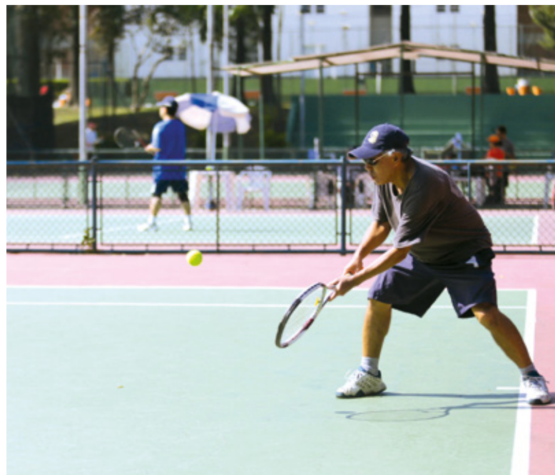
Partida de tênis durante seletiva para Jogos Regional em 2017

Inscrições: (11) 5613-5601, 96334-1276 (WhatsApp) ou esportes@apcefsp.org.br.