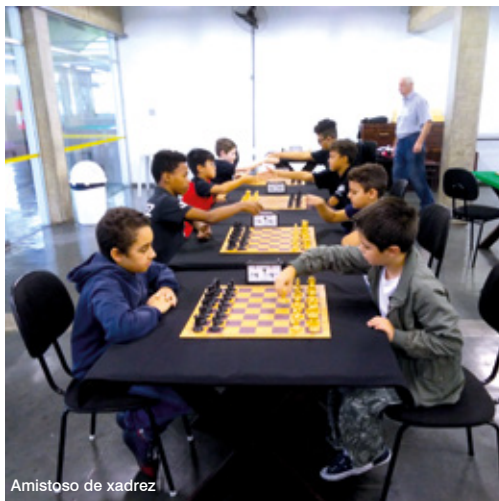
Amistoso de xadrez