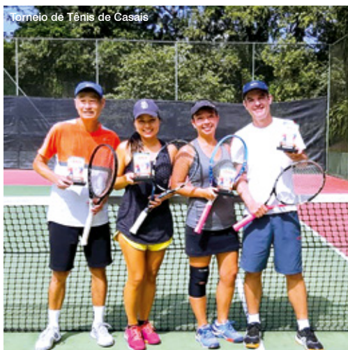
Torneio de Tênis de Casais