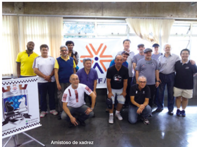
Amistoso de xadrez