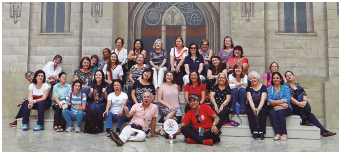
O APCEF nos Passos da Cultura levou associados ao Mosteiro de São Bento em agosto do ano passado

Informações e inscrições - Ligue (11) 3017-8339, envie e-mail para convites@apcefsp.org.br ou acesse nosso site www.apcefsp.org.br .