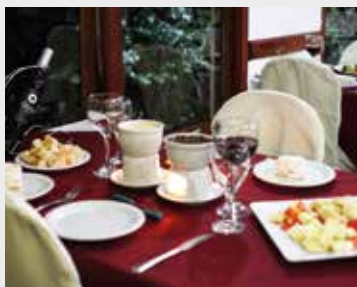
Delícia de fondue servido na Colônia da APCEF