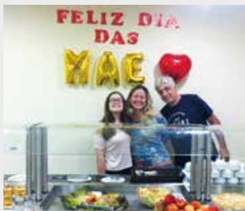
Comemoração do Dia das Mães em Avaré, em 2017

Ligue e confira as condições para aproveitar a promoção.