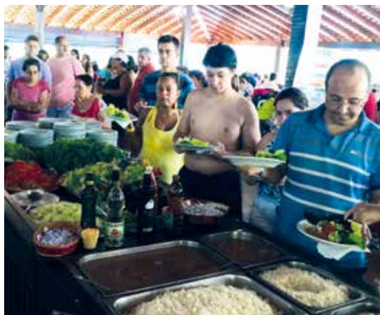
Almoço durante o primeiro APCEF em Movimento realizado em Campinas, em abril de 2015

Todos os associados e dependentes estão convidados. Há programação para toda a família: churrasco, atividades esportivas e recreativas, oficinas e muito mais.