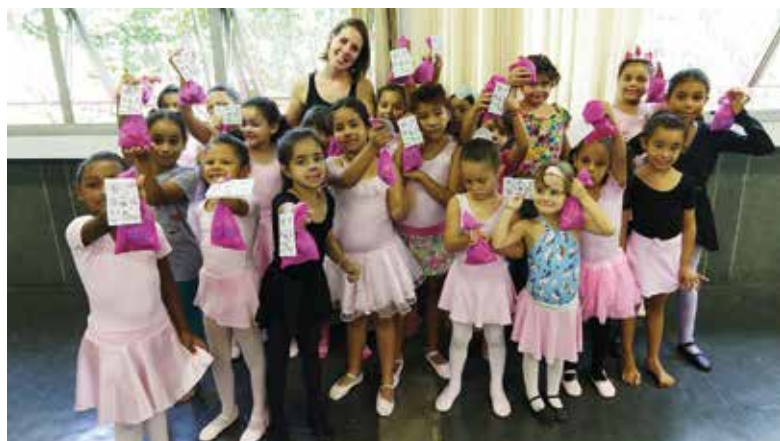
Comemoração da Páscoa, em 2018, das crianças que participam do projeto de balé do CDH Cecom