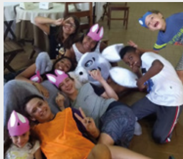
Comemoração de Páscoa em Avaré, em 2018

As reservas para hospedagem durante todo o mês de maio nas Colônias da APCEF/SP foram abertas na terça-feira, dia 12. Ligue e garanta sua vaga. Verifique, também, a disponibilidade para o feriado da Páscoa (de 18 a 21 de abril).