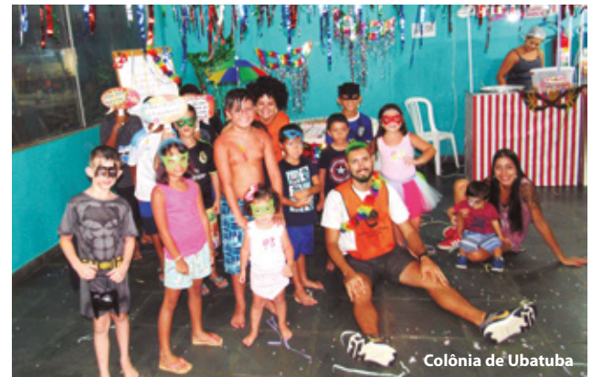
Colônia de Ubatuba

Para ver mais fotos e vídeos, acesse www.apcefsp.org.br > Informações > Multimídia