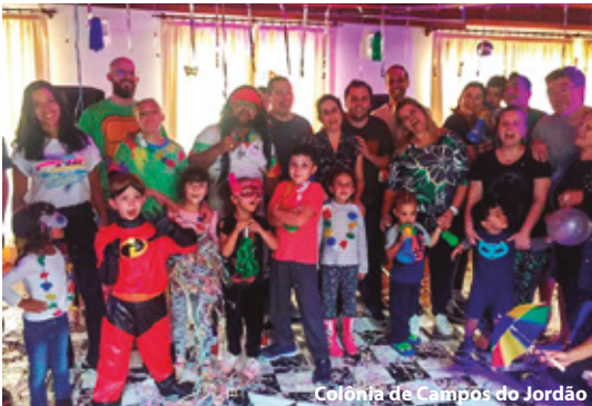
Colônia de Campos do Jordão