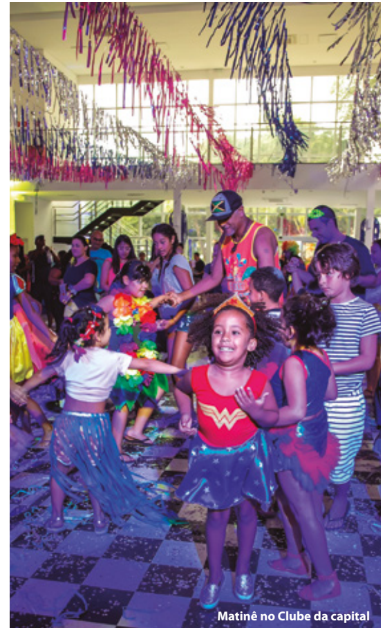
Matiné no Clube da capital