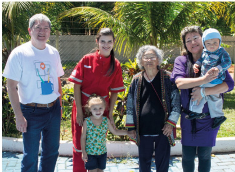
Participantes do APCEF em Movimento na Subsede de Bauru, em outubro de 2018

Santos - Em maio, dia 4, será a vez de comemorar o aniversário da APCEF/SP no Sesi Santos.