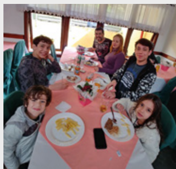
Comemoração do Dia das Mães em Campos do Jordão em 2018

Ligue, faça sua reserva e aproveite um fim de semana especial nas Colônias da APCEF.