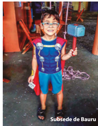
Subsede de Bauru