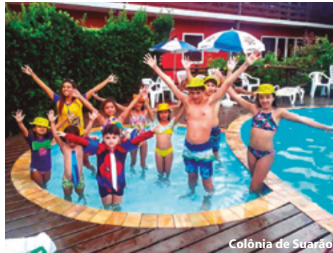
Colônia de Suarão