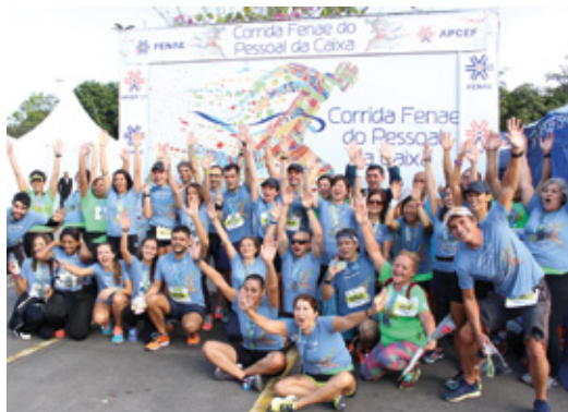
Primeira etapa da Corrida Fenaé em 2018 também foi junto com Graacc

O valor da inscrição inclui kit Graacc e Fenaé. Escolha seu percurso (5k, 10k ou caminhada de 3k) e inscreva-se!