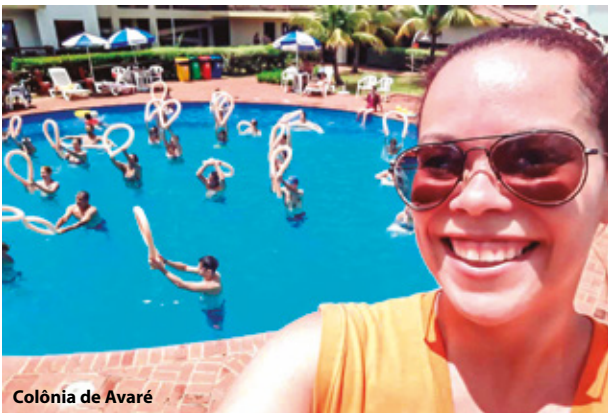
Colônia de Avaré