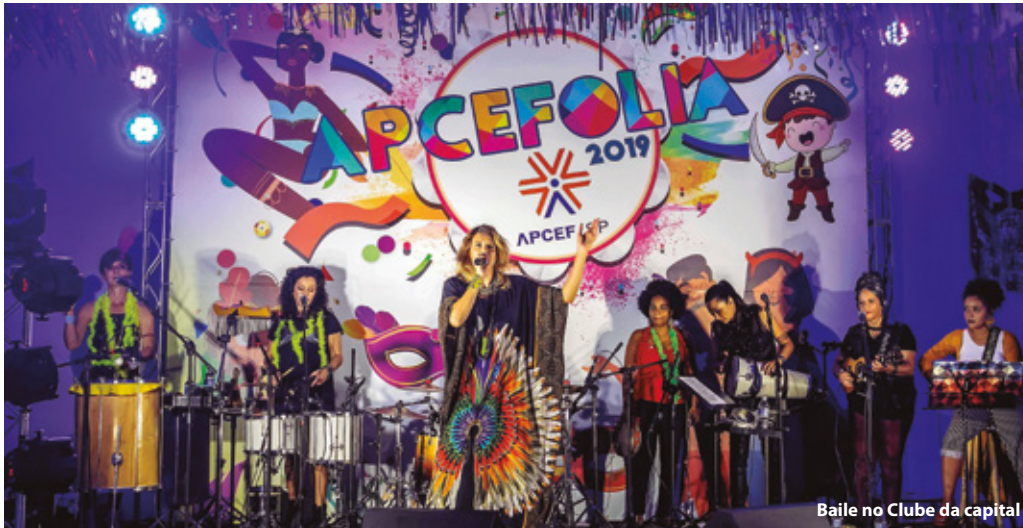
Baile no Clube da capital