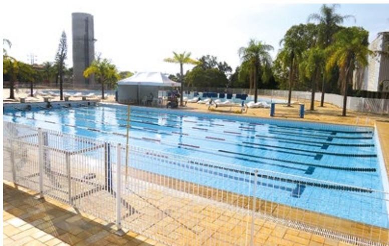
Piscina do Sesi Ribeirão Preto

Evento para toda a família está marcado para 13 de abril, sábado, no Sesi Ribeirão Preto