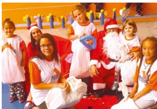
Festa de Natal e entrega de kits organizados pela ONG e pela APCEF/SP para as crianças atendidas pelo CDH Cecom