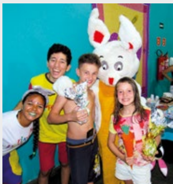
Comemoração de Páscoa em Ubatuba

É só ligar e assegurar a diversão para a família toda.