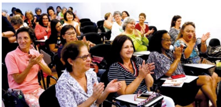
Inscrições e informações: (11) 3017-8339 ou convites@apcefsp.org.br.

Dia Internacional da Mulher, com oficina criativa de voz, workshop de automassagem e o tradicional chá da tarde com comemoração dos aniversariantes.