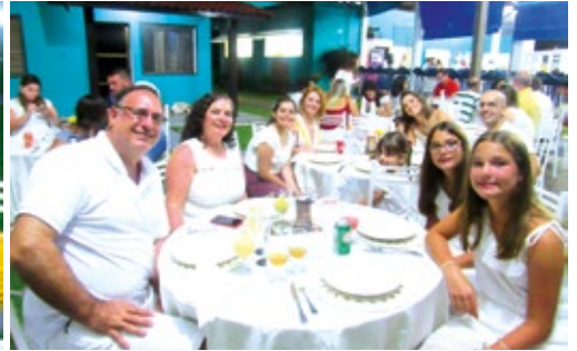
Colônia de Ubatuba