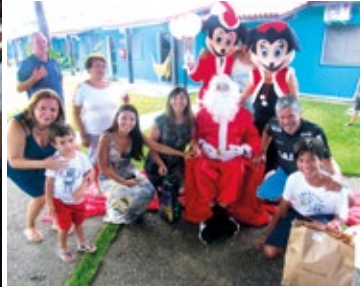
Colônia de Ubatuba