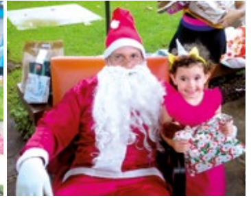
Colônia de Suarão