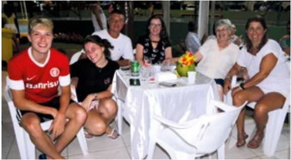
Colônia de Suarão