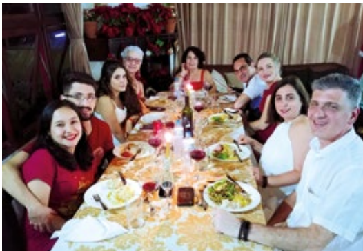
Colônia de Campos do Jordão