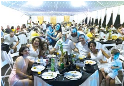
Colônia de Avaré