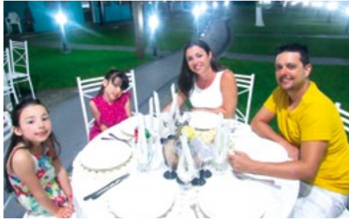
Colônia de Ubatuba