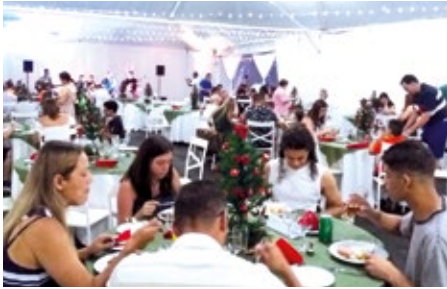
Colônia de Avaré