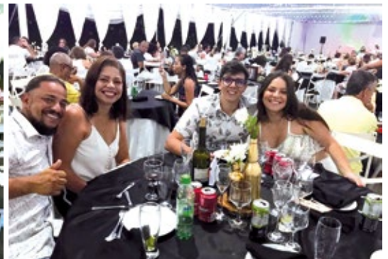
Colônia de Avaré

Para ver mais fotos e vídeos, acesse www.apcefsp.org.br > Informações > Multimídia