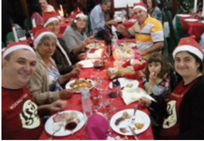
Colônia de Campos do Jordão