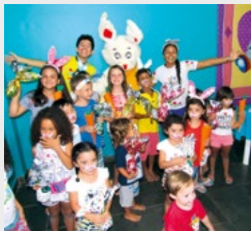
Comemoração da Páscoa em Ubatuba

É só ligar e fazer sua reserva. Consulte, também, a disponibilidade de vagas para janeiro, fevereiro e carnaval.