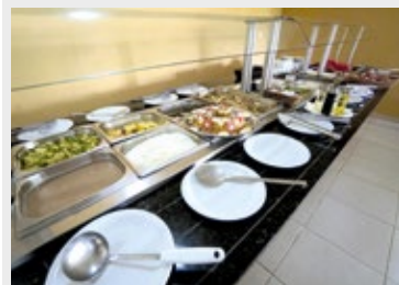
Refeições deliciosas estão incluídas nos valores das diárias de Avaré

Consulte a disponibilidade de vagas para Natal, Ano Novo, carnaval e janeiro e faça agora mesmo sua reserva.