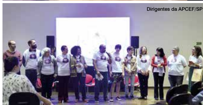
Dirigentes da APCEF/SP