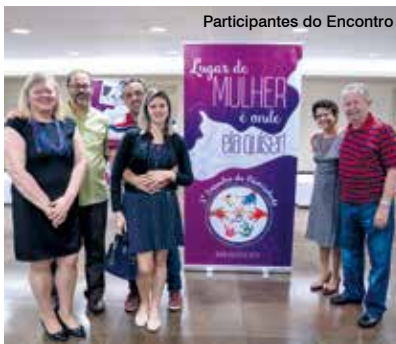
Participantes do Encontro