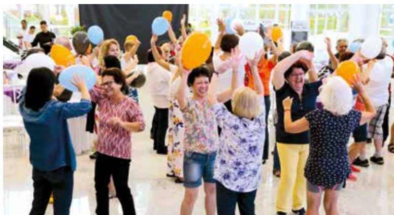
Encontro Anual dos Aposentados em 2017, no Centro de Eventos da APCEF/SP

Associado e dependente paga R$ 10; convidado, R$ 50; crianças até 5 anos são isentas. Inscreva-se pelo (11) 3017-8339 ou convites@apcefsp.org.br.