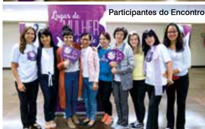
Participantes do Encontro