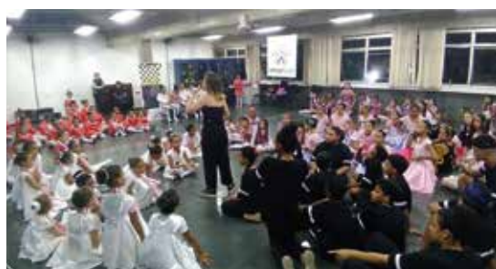
Crianças atendidas pela ONG durante festa de Natal no clube da APCEF

16 Dias de Ativismo - O megabazar "A Força do Bem" - parceria da Caixa, APCEF/SP, Agecef/SP e ONG - será realizado em paralelo à campanha "16 Dias de Ativismo" promovida pelo Programa Diversidade Caixa da Gerência Nacional de Negociação Coletiva e Relacionamento com Empregados (Gener).