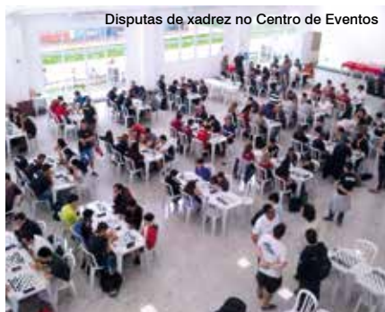
Disputas de xadrez no Centro de Eventos