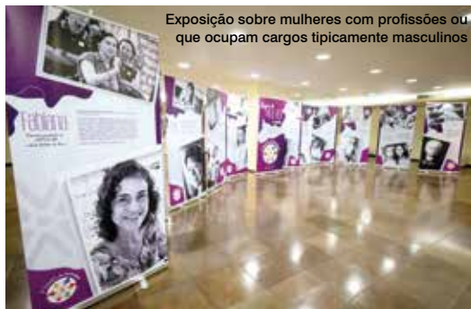
Exposição sobre mulheres com profissões ou que ocupam cargos tipicamente masculinos