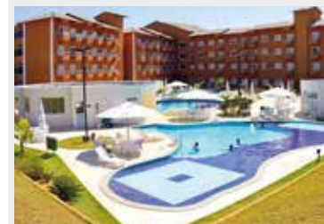
Flat Lagoa Quente, da APCEF Goiás

Você sabia que associados e dependentes da APCEF/SP podem utilizar os espaços disponíveis nas Associações do Pessoal de todo o país?