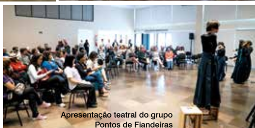
Apresentação teatral do grupo Pontos de Fianças