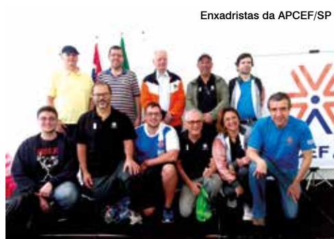
Enxadristas da APCEF/SP