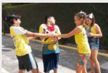
Bagunça boa na Colônia de Campos do Jordão no carnaval de 2018

Consulte a disponibilidade de vagas para os próximos feriados e período de férias.