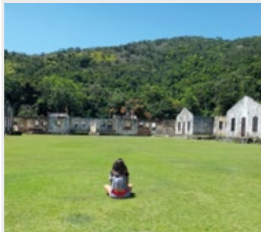
Ilha Anchieta: passeio que não pode faltar para quem se hospeda na Colônia de Ubatuba

Consulte a disponibilidade de vagas para os demais períodos.