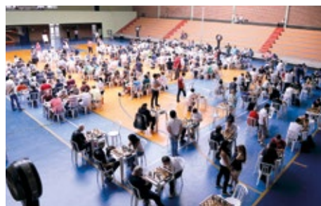
Torneio relâmpago da Federação Paulista de Xadrez, em 2016

Dia 2 de novembro, sexta-feira (feriado), o clube da APCEF/SP na capital sediará a Copa Franco Montoro de Xadrez.