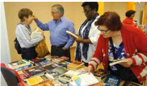
Para ver mais fotos e vídeos, acesse www.apcefsp.org.br > Informações > Multimídia