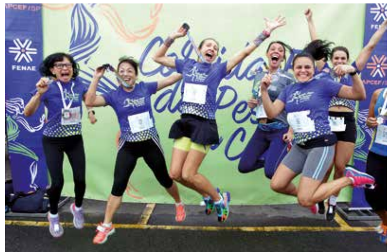
Corrida Fenae do Pessoal da Caixa em 2017, realizada durante evento do Graacc

Inscrições até 1º de maio no site da APCEF/SP. Informações pelo telefone (11) 5613-5601 ou e-mail esportes@apcefsp.org.br .