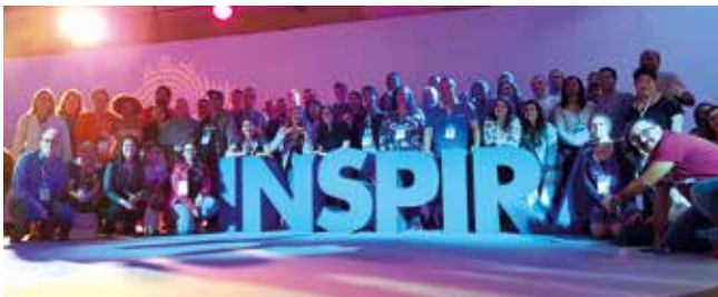
Participantes de São Paulo no Inspira Feneae 2018, no Rio de Janeiro