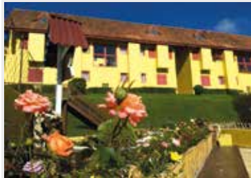
Detalhes que fazem a diferença para uma hospedagem agradável em Campos do Jordão

Para hospedagem em julho, em Campos do Jordão, as reservas estão abertas desde março.