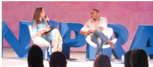
Monica Iozzi entrevistou Lázaro Ramos durante o evento nacional