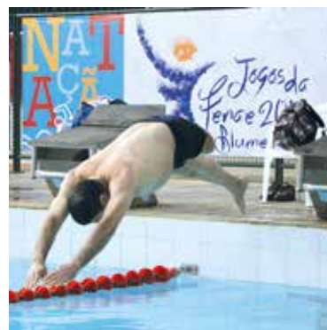
Prova de natação paralímpica nos Jogos da Fenae 2016, em Blumenau, Santa Catarina

Para se associar, acesse www.fenae.org.br/associacao . Informações sobre os Jogos, ligue (11) 5613-5601.