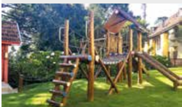
Diversão para as crianças em Campos do Jordão

A Colônia de Avaré oferece 30% de desconto em suas diárias para hospedagens até 27 de abril. Campos do Jordão e Suarã estão com 10% de desconto. Aproveite!