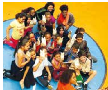
Festa de Páscoa da ONG no clube, em 2017

Para conhecer o trabalho da Moradia e Cidadania, acesse www.moradiaecidadania.org.br .