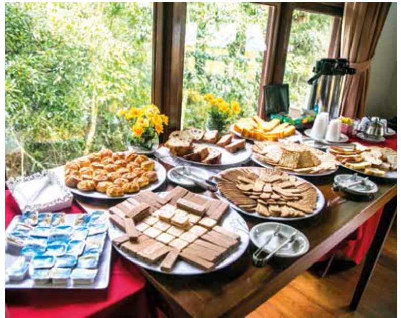
Delícia de café da manhã na Colônia de Campos do Jordão