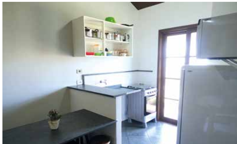
Cozinha equipada do apartamento da Colônia de Suarão

Em março, as Colônias de Campos do Jordão e Avaré estão com 20% de desconto nos valores das diárias, que incluem café da manhã, almoço, chá da tarde e jantar.