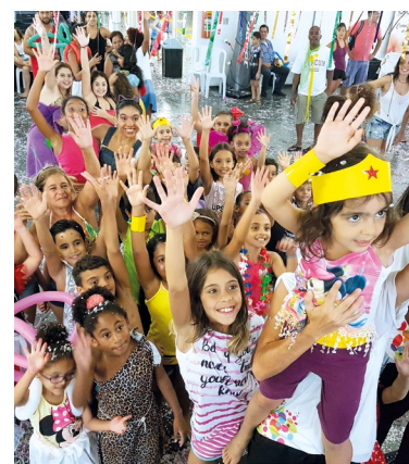
As crianças se divertem Carnaval 2017, no clube

Colônias - As crianças hospedadas nas Colônias, no período do carnaval, vão ganhar os abadás exclusivos do APCEFolia.