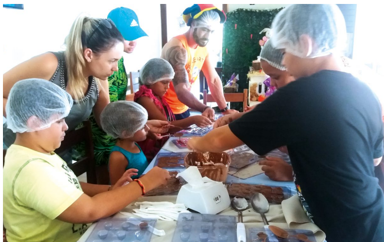
Oficina de confecção de ovos de chocolate com as crianças, na Colônia de Avaré, em 2017

Abertura da reserva será em 6 de fevereiro, terça-feira, a partir das 7 horas