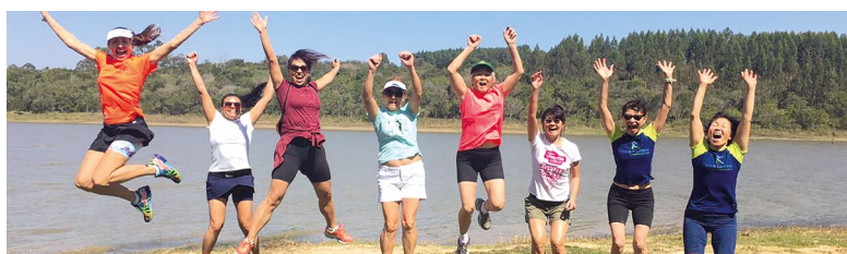
Associadas da APCEF/SP participam de competição de corrida na cidade de Avaré, em 2017

A corrida traz benefícios para o corpo, para a mente e para a alma.