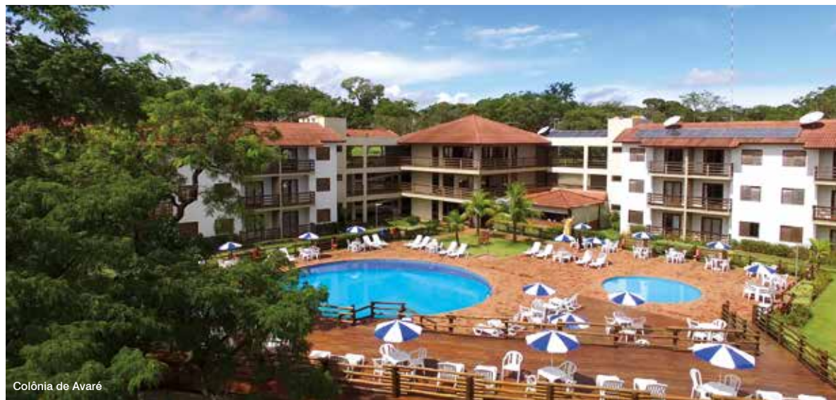
Colônia de Avaré

No dia 6 de fevereiro, terça-feira, às 7 horas, serão abertas as reservas para hospedagem durante o feriado da Páscoa (de 29 de março a 1º de abril) em todas as Colônias da APCEF. Garanta sua vaga, é só ligar!