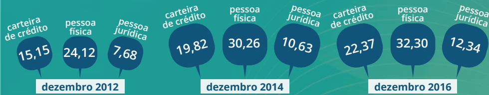
Participação de mercado da Caixa (em %)