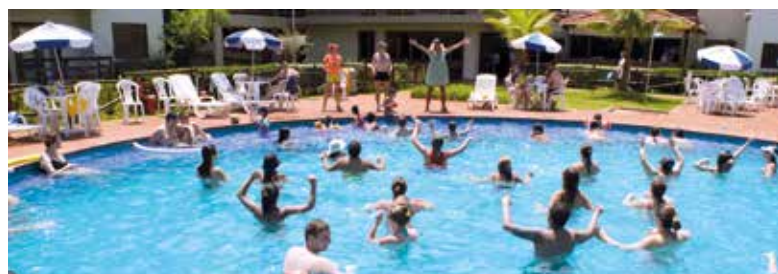
Colônia de Avaré