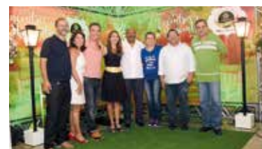
Diretores da APCEF/SP em comemoração do Dia do Aposentado no início de 2017

Dia 4 de fevereiro, domingo, os aposentados da Caixa têm um encontro especial: comemoração do Dia do Aposentado no Espaço de Eventos Hakka, próximo à estação São Joaquim do metrô, na capital.