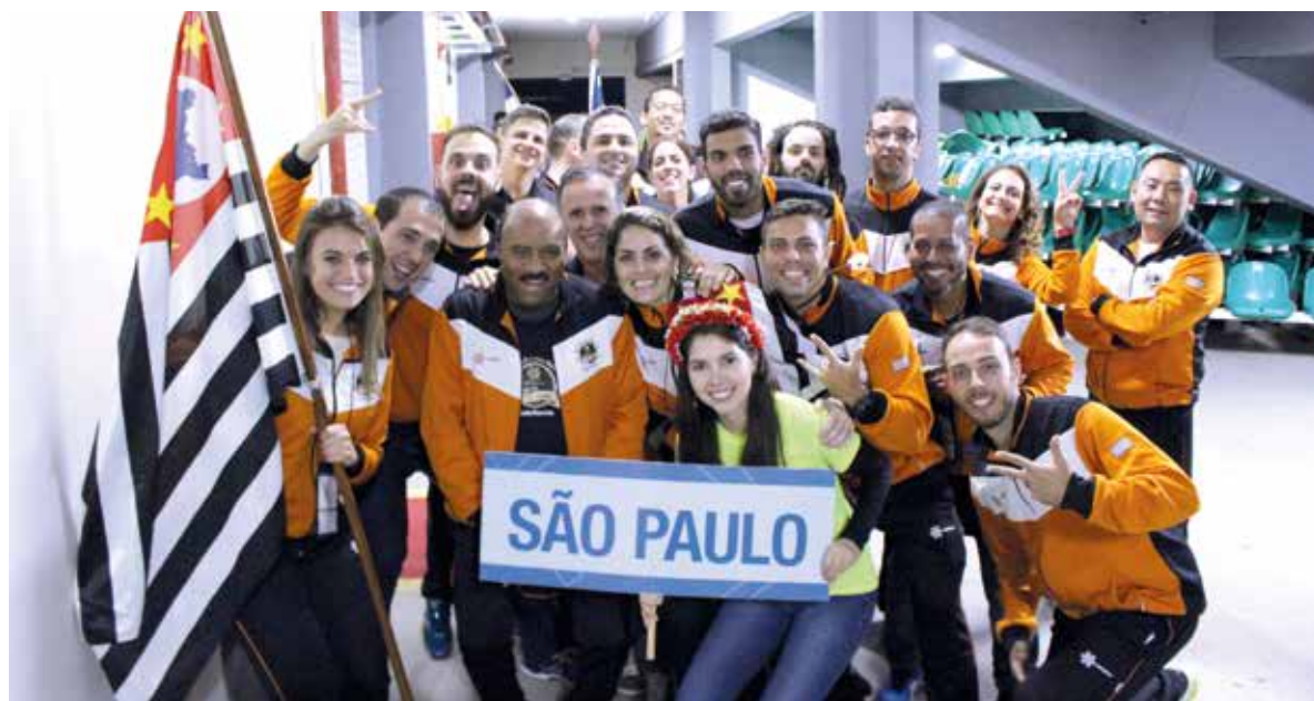
Abertura dos Jogos da Fenae 2016, em Blumenau, Santa Catarina

A 12ª edição ocorreu em Blumenau (SC), de 20 a 27 de agosto, com a participação de mais de dois mil atletas. Os jogos de 2016 foram marcados pela inclusão de uma prova paralímpica na natação.