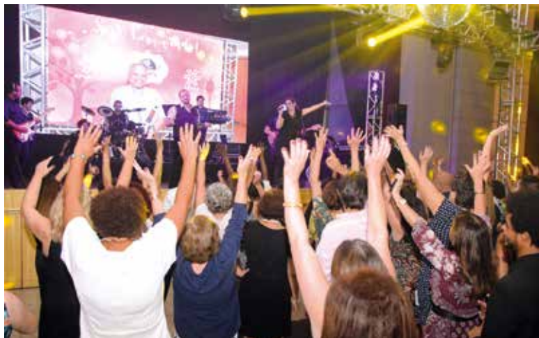
Comemoração do Dia dos Aposentados, em janeiro: um dos eventos tradicionais organizados pela APCEF

A APCEF/SP disponibilizará gratuitamente o traslado da estação Conceição do metrô até o clube das 8h20 às 10 horas. Retorno a partir das 16 horas.