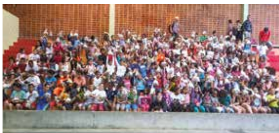
Festa das crianças do CDH Cecom, no clube, em 2016

Para atuar como voluntário na festa das crianças do CDH Cecom, envie e-mail com nome, matrícula e telefone para moradia-cidadaniacecom@gmail.com .