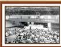
2º Encontro Nacional dos Empregados da Caixa, atividade preparatória para a Campanha de 6 Horas e o Direito à Sindicalização - 1985