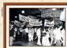
Paralisação dos empregados da Caixa reivindicando a jornada de 6 horas e o direito à sindicalização - 1985