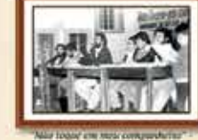
"Não toquem em meus companheiros" - Demissão de 1990