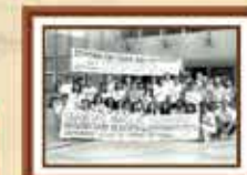
Empregados da Caixa demitidos na greve de 1991 e reintegrados ao banco em 1992