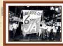
Paralisação dos empregados da Caixa reivindicando a jornada de 6 horas e o direito à sindicalização - 1985