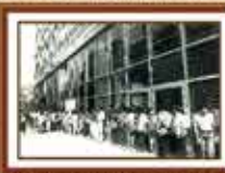
Comissão de esclarecimento em frente da agência Avenida Paulista - 1985