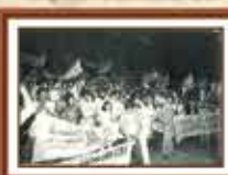
Constituição dos empregados da Caixa na entidade do Tesouro Nacional após paralisação voluntária da jornada de 6 horas e o direito à sindicalização - 1985