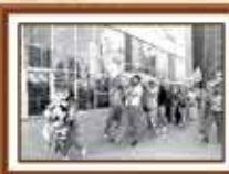
Companhia Salarial de 1991 - Avenida Paulista, 2.862