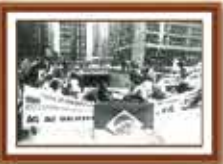
Paralisação de 1985 - Avenida Paulista (antiga sede da Caixa)