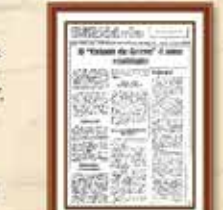
Folheto Nova Luta Bancária sobre greve - 1985