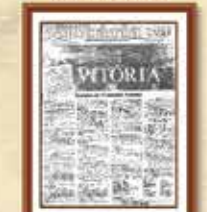
Atividade de construção do processo do movimento dos empregados da Caixa iniciado em 1985