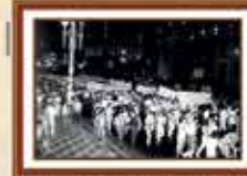
Paralisação dos empregados da Caixa reivindicando a jornada de 6 horas e o direito à sindicalização - 1985