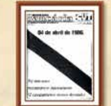
"Campanha por não poder ficar mais triste" - Demissão de 1984. Os empregados foram readmitidos em 1987