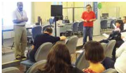
Reuniões na agência Augusta e Bela Vista (acima), ambas na capital, e na agência Gonzaga, no litoral

Mas, ao mesmo tempo em que chama atenção para o problema do contencioso, não informa providências relativamente a sua cobrança. E para tanto, a Fundação não depende de autorização de quem quer que seja.