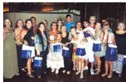
Grupo da APCEF/SP no Cruzeiro América do Sul, em fevereiro, que passou pelo Uruguai e Argentina

Mais informações no site da APCEF/SP: www.apcefsp.org.br