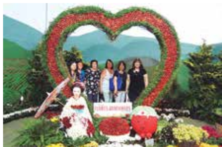
No ano passado, em setembro, os aposentados visitaram a Festa das Flores e Morangos de Atibaia

Quer conhecer a maior exposição de flores e plantas ornamentais da América Latina? Então inscreva-se para a excursão organizada pela APCEF/SP para Holambra.