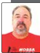
Secretário de Assuntos Socioeconômicos Fábio Moreira de Camargo Leite