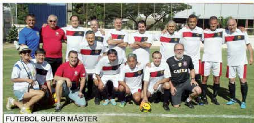
FUTEBOL SUPER MÁSTER