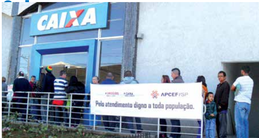
Manifestação na agência Jardim Colonial, zona leste da capital, inaugurada recentemente com número insuficiente de empregados, em uma região carente de bancos

Desde julho, a APCEF/SP está organizando protestos, reuniões e abaixo-assinados em agências da Caixa com o objetivo de chamar a atenção da direção do banco para o problema da falta de empregados.