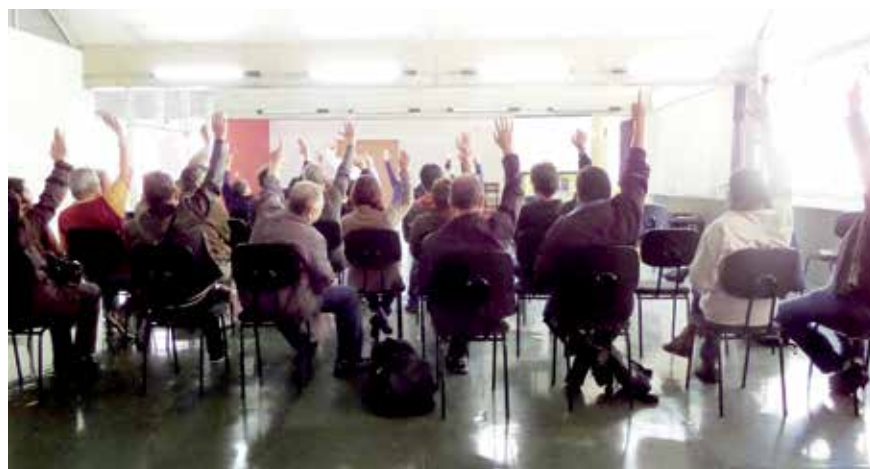
Associados aprovam, em assembleia, balanços da APCEF/SP

Obrigações trabalhistas e sociais - referem-se a pagamento de INSS, FGTS, PIS sobre folha de pagamento e contribuição sindical. São encargos sobre a folha de pagamento da enti-