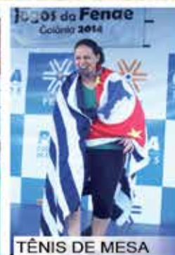
TÊNIS DE MESA