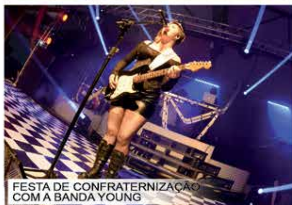
FESTA DE CONFRATERNIZAÇÃO COM A BANDA YOUNG