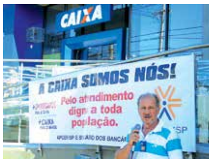
Protestos na agência Vila Virgínia, em Ribeirão Preto, inaugurada com apenas oito empregados

“Queremos o apoio dos clientes e da população para que a Caixa contrate mais empregados e elimine as deficiências. Só assim o trabalhador terá condições de exercer suas tarefas dentro do expediente para o qual foi contratado e oferecer um atendimento de qualidade aos clientes e usuários do banco”, contou o diretor-presidente da APCEF/SP.