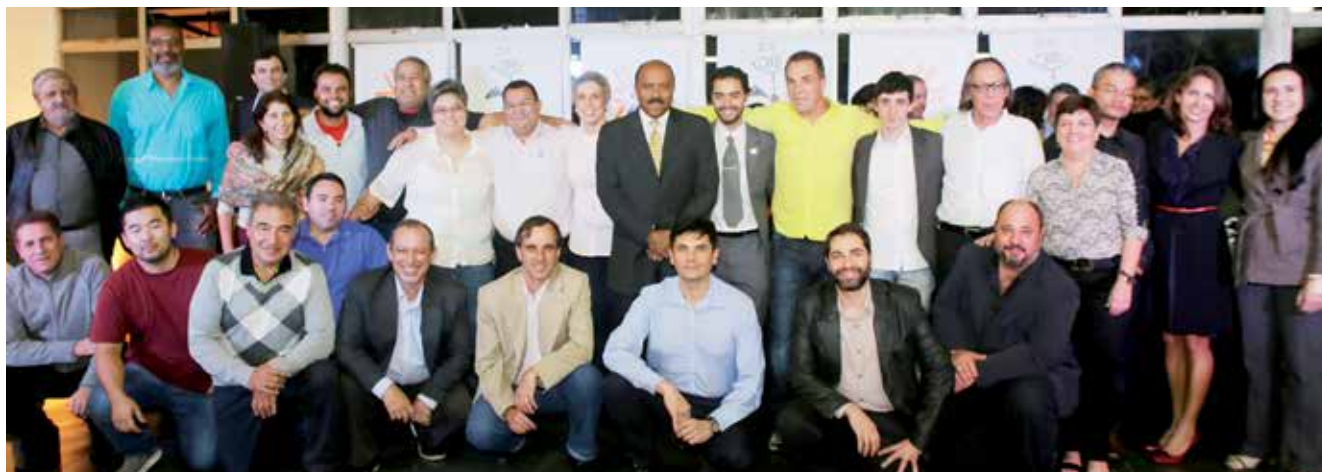
Diretores, secretários e membros do Conselho Deliberativo da APCEF/SP durante a cerimônia de posse, em 10 de maio

A assembleia de posse dos diretores e membros do Conselho Deliberativo, em 10 de maio, encerrou o processo eleitoral de renovação dos empregados que comandam a Associação de Pessoal da Caixa Econômica Federal de São Paulo (APCEF/SP), iniciado em 22 de fevereiro deste ano.