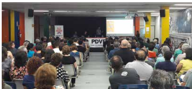
Palestra sobre o PDVE, em fevereiro, auxiliou os empregados em suas dúvidas sobre o Programa

Além disso, a direção da Caixa divulgou nesta semana uma reestruturação que prevê a extinção de filiais e a migração de trabalhadores. "Precisamos nos unir e lutar em defesa da Caixa, pois os ataques são cada vez mais intensos por parte do governo", finalizou.