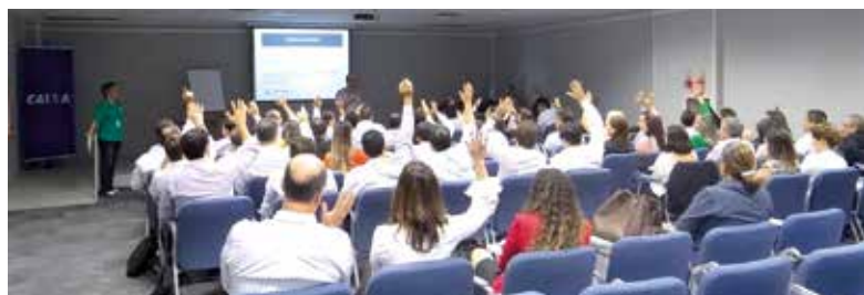
Em 2015, a APCEF/SP realizou reuniões em todo o estado para discutir os problemas da Funcef