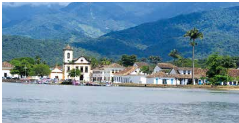
Vista da cidade de Paraty durante passeio de escuna: uma das atividades previstas na excursão da APCEF

Informações sobre eventos: (11) 3017-8339 • convites@apcefsp.org.br WhatsApp (11) 97612-3900