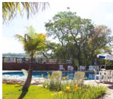
Avaré: recanto ideal para descansar

Confira os períodos em que há vagas nas Colônias e entre em contato para fazer a reserva.