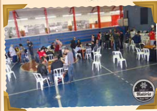
Nosso #tbt desta semana relembrou o processo eleitoral de 2014. Na foto, apuração da eleição, que aconteceu na quadra do Sindicato dos Bancários de São Paulo, Osasco e região, na Sé. #apcefsp #eleição #apuração