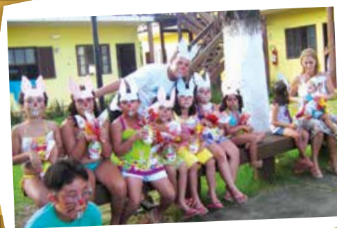
Nosso #tbt de 13 de abril relembrou as programações especiais durante o feriado da Páscoa, nos espaços coletivos da APCEF/SP. Em destaque, criança aproveitou as brincadeiras promovidas pela equipe de recreação na Colônia de Suarão, em 2009. Siga-nos no Instagram e conheça um pouco da história desta grande Associação.