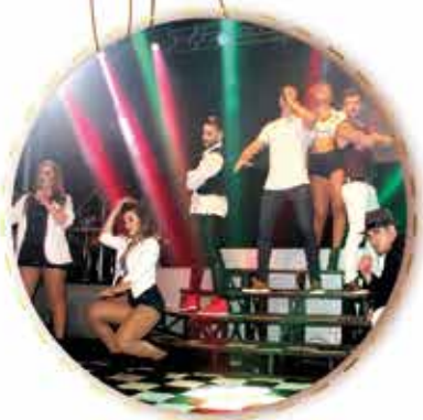
Show com a Banda Young