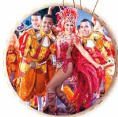
Bateria da escola de samba Tom Maior

Uma data especial com música, jantar*, danças, projeções, túnel do tempo e muito mais!