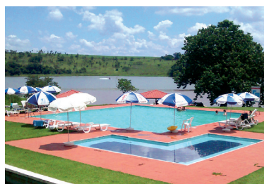
Belíssima Colônia de Salto Grande

Garanta dias divertidos no carnaval de 2017, período de 24 a 28 de fevereiro. As reservas em todas as Colônias da Associação serão abertas no próximo dia 24,