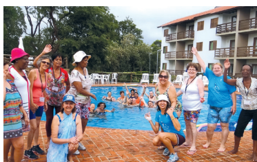
Muita alegria em excursão para Avaré em 2014

Para se inscrever, envie e-mail para convites@apcefsp.org.br ou ligue (11) 3017-8339 até 2 de dezembro. Em breve, serão divulgados os valores e a programação. Fique atento!