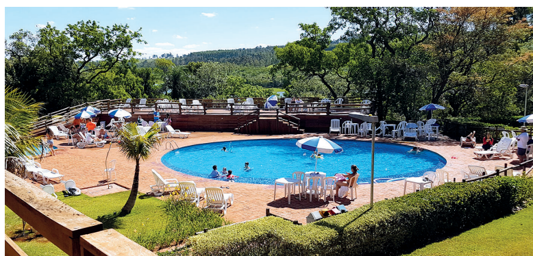
Vista da sacada de um dos apartamentos de Avaré

-mail convites@apcefsp.org.br ou pelo telefone (11) 3017-8339.