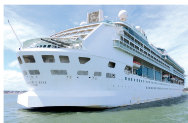
Viagem em fevereiro de 2016

Pelo terceiro ano consecutivo, a APCEF/SP firmou parceria com a Casa do Agente para organizar viagens de navio imperdíveis em 2017.