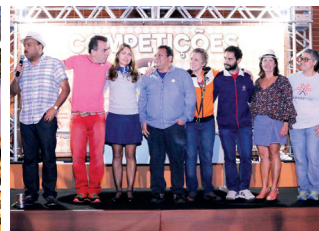
Diretores da Associação prestigiam Festa do Choque no clube no último dia 5