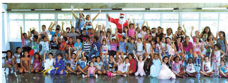
Festa de Natal da ONG Moradia e Cidadania em 2015, no clube da APCEF/SP

Conheça mais no site www.moradiaecidadania.org.br ou nas redes sociais ( www.facebook.com/spmoradia ).