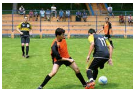
Partida da Liga de Society em 2015

Haverá congresso técnico no dia 22 de outubro, sábado, às 10 horas, no salão de jogos do clube.