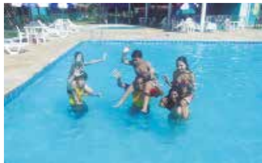
Colônia de Ubatuba, litoral norte

É só escolher o período, ligar na Colônia na data marcada e fazer a reserva.