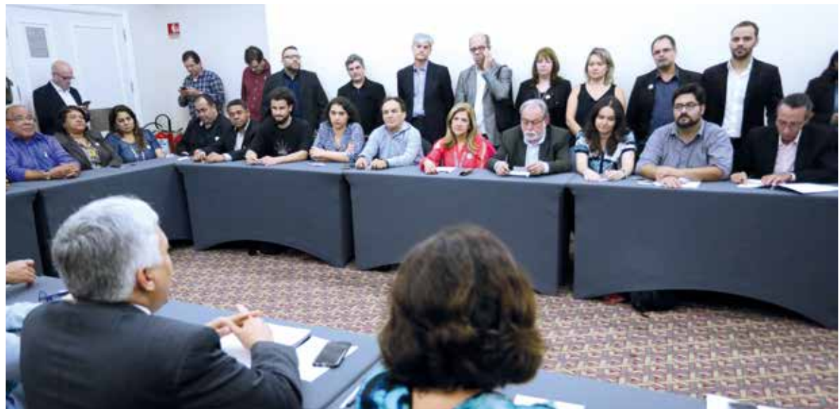
Assinatura do aditivo específico dos empregados da Caixa, que garantiu PLR Social, manutenção das cláusulas e discussão da RH 184

Acordos disponíveis no site - Para ter acesso ao conteúdo completo dos acordos assinados (Convenção Coletiva dos Bancários e Acordo Coletivo específico da Caixa), acesse www.apcefsp.org.br > Informações > Acordos Coletivos.