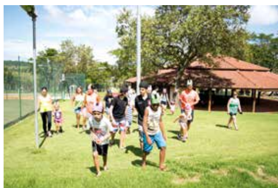
Avaré: brincadeiras com as crianças no feriado da Páscoa