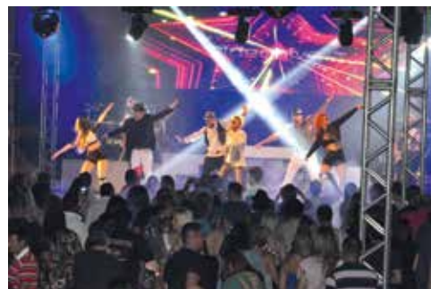
Apresentação da Banda Young na Festa do Chope de 2015

Informações pelo e-mail convites@apcefsp.org.br ou no telefone (11) 3017-8339.