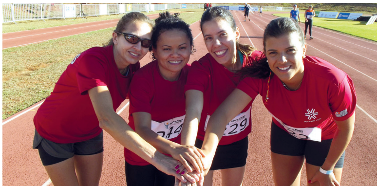
Equipe feminina de atletismo da APCEF/SP, nos Jogos da Fenae de 2014, em Goiânia