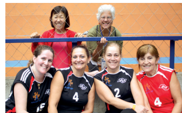
Turminha do vôlei nos Jogos de 2015, no clube

Inscreva-se até dia 16 de setembro para participar da 6ª edição dos Jogos dos Aposentados.