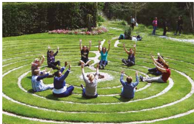
Visita ao Museu Amantikir, em Campos do Jordão, na excursão do ano passado

Para mais informações, entre em contato pelo (11) 3017-8339 ou convites@apcefsp.org.br .