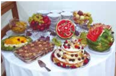
Mesa de frutas e sobremesas preparadas para o Natal em Avaré no ano passado

Para o Réveillon (de 30 de dezembro a 1º de janeiro), as reservas serão abertas no dia 25.