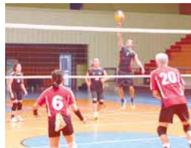
Vôlei misto nos Jogos dos Aposentados 2015

A sexta edição dos Jogos dos Aposentados de São Paulo - organizados pela Apea em parceria com a APCEF - já está marcado.