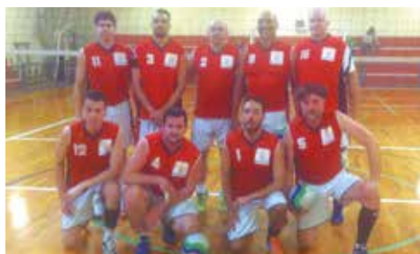
À esquerda, participantes da segunda edição do Torneio Estadual de Xadrez Pensado da APCEF/SP, no clube, dia 25. Na outra foto, equipe de vôlei da Associação, campeã da série prata do Super Grand Prix LMN Sports