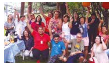
APCEF de Portas Abertas no clube, no ano passado

Participe, inscrições até 1º de agosto pelo (11) 3017-8339 ou convites@apcefsp.org.br .