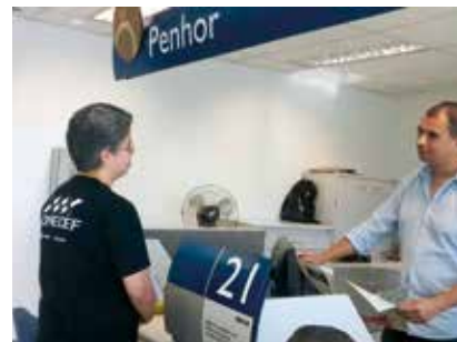
Manifestações em 12 de julho, Dia de Luta, na agência e Giret São José do Rio Preto e, na foto à direita, em Osasco. Para ver mais fotos, acesse www.facebook.com/apcefsp