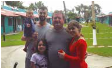
Hóspedes no Dia dos Pais em Ubatuba

De 8 a 14 de agosto, segunda-feira a domingo, pai associado (titular), acompanhado do filho pagante, não paga a hospedagem nas Colônias de Avaré, Campos do Jordão e Ubatuba.