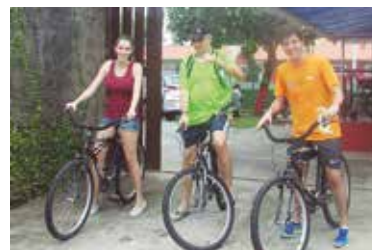
Associados passeiam de bicicleta em Suarão

São 34 apartamentos com acomodações para até seis pessoas, cozinha completa, roupas de cama e banho, a duas quadras da praia. Um desses apartamentos é adaptado para atender pessoas com deficiências. Aproveite!