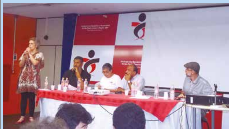
Primeiro Encontro Estadual para debater a Funcef em 19 de março

Informações sobre o Encontro Estadual, ligue (11) 3017-8315 ou envie e-mail para sindical@apcefsp.org.br .