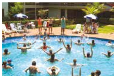
Carnaval na Colônia de Avaré

As Colônias de Avaré, Campos do Jordão, Salto Grande e Suarão ainda têm vagas. Ubatuba está com lista de espera para o feriado de Tiradentes e fecha em maio para manutenção.