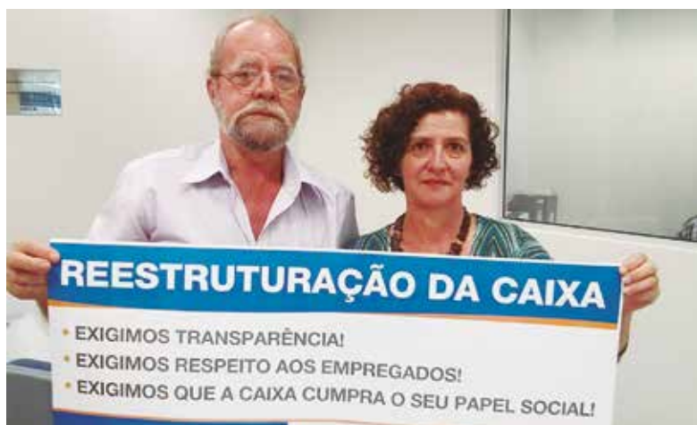
Manifestação contra a reestruturação em Jundiaí, em 10 de março