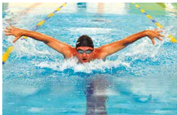
Foto acima, seletiva de atletismo para os Jogos Nacionais da Fene, no Cepeusp, em 19 de março. Na outra foto, seletiva de natação em Bauru, no mesmo dia. Para saber mais ou ver outras fotos, acesse www.apcefsp.org.br ou www.facebook.com/apcefsp