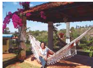
Passeio pelo interior de São Paulo em agosto do ano passado

Inscrições até 15 de abril pelo telefone (11) 3017-8339 ou convites@apcefsp.org.br.