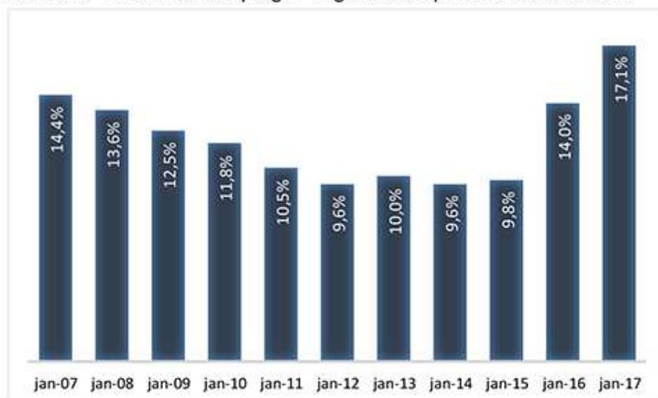
Gráfico 1 - Taxa de desemprego – região metropolitana de São Paulo

Na região metropolitana de São Paulo, o desemprego alcançou 17,1% em janeiro de 2017, segundo Pesquisa de Emprego e Desemprego do DIEESE/SEADE. O índice corresponde a 1,8 milhão de cidadãos que integram a população economicamente ativa. É o maior desemprego desde janeiro de 2007, ano cuja marca foi 14,4%, equivalente a 1,4 milhão de trabalhadores sem trabalho contratado.