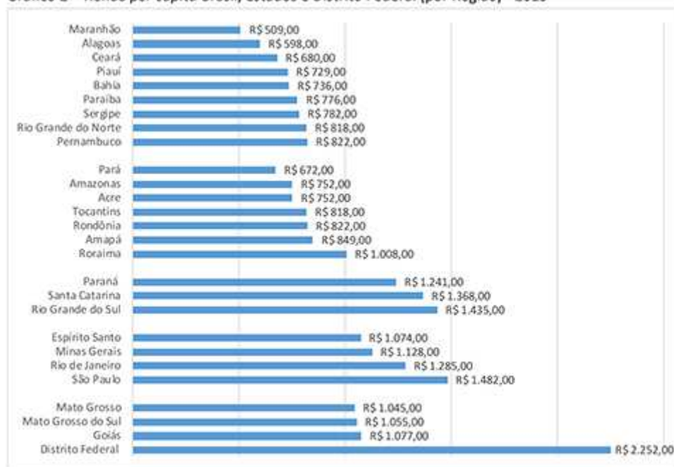
Gráfico 2 - Renda per capita Brasil, Estados e Distrito Federal (por Região) - 2015