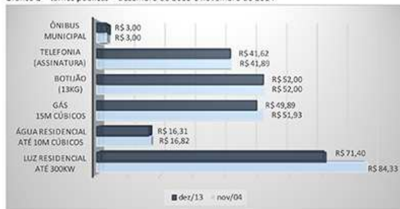
Gráfico 2 – tarifas públicas – dezembro de 2013 e novembro de 2014

Os últimos 12 meses não se mostraram tão trágicos para o paulistano em relação às tarifas públicas. No comércio de botijão de gás manteve-se o valor, da mesma forma tarifa de ônibus municipal. Assinatura básica de telefonia cresceu 0,65%, água 3,13% e gás encanado 4,09%. Por outro lado, a tarifa de luz residencial, consumo até 300kw, subiu 18,11%. O Índice Nacional de Preços ao Consumidor Amplo (IPCA) acumulado de dezembro de 2013 a novembro de 2014 foi de 6,56%.